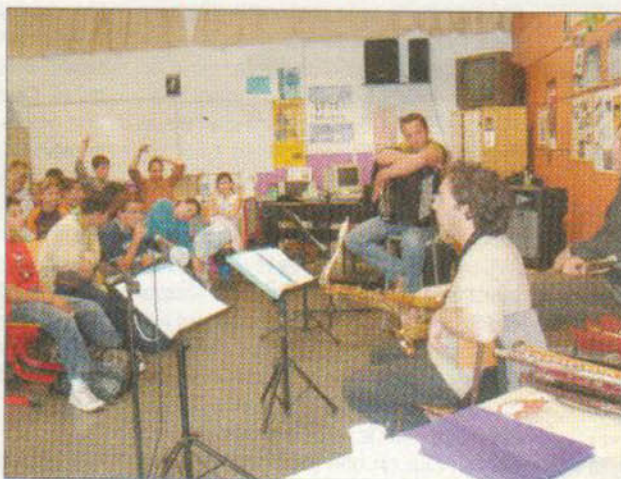
Questions aux musiciens

E n avant-première du festival proprement dit Jazzèbre a multiplié les animations dans des milieux divers. Jeudi dernier nous avons retrouvé le groupe Hradcany au collège Mermoz de St Laurent de la Salanque. Deux classes étaient réunies : la 6ème PAC Musique et une 5ème pour écouter les musiciens et leur poser des questions. Ambiance décontractée mais studieuse, même à la fin, point de chahut dans les rangs. Ceux qui ne posent